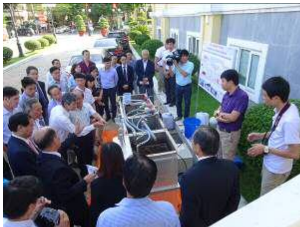
案件化調査報告会でのテスト機デモ風景