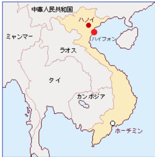
ハイフォン位置図