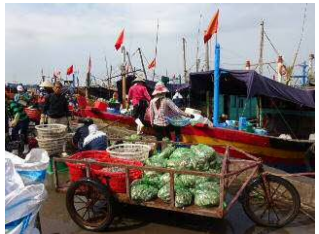
ゴックハイ海産物卸売市場（排水システム設置予定地）