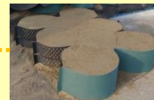
遮蔽剤(ジオセル+土砂等)