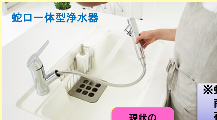
蛇口一体型浄水器

オーストラリアにおいて、蛇口一体型浄水器のユーザ受容性に関する実証試験を行い、今後の海外モデルとなるダイレクトマーケティングの販路拡大を推進する。併せて現地で消費されるペットボトルウォーターをエコロジーな浄水器に切替えることで環境負荷を低減する。