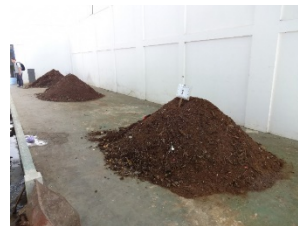
サンプル堆肥試作