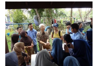
コンポスト改善指導