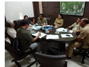
バリクパパン市との協議