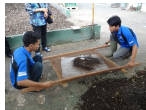
サンプル堆肥試作