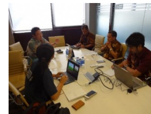
国営肥料会社との協議